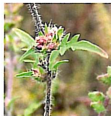
weibliche Blüte Samenträger

In Privatgärten und Parkanlagen, entlang von Strassen und Bahnen, auf Kompostplätzen und Ruderalstellen, in Kiesgruben, auf Baustellen und in landwirtschaftlichen Kulturen.