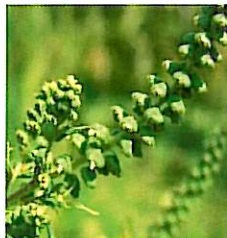
männliche Blüte Pollenspender

Ambrosia ist eine ruderaler Pflanzentart. Sie besiedelt sichtbaren Boden (Erde, Sand, Kies) und kann wegen ihres flächendeckenden Ausbreitungspotentials die einheimische Flora verdrängen und damit die Biodiversität gefährden.